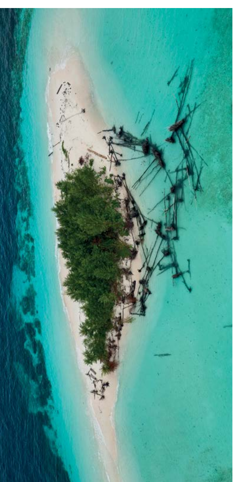
Raya Ampat Inseln, Indonesien